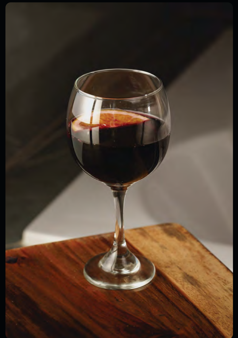
Tinto de verano